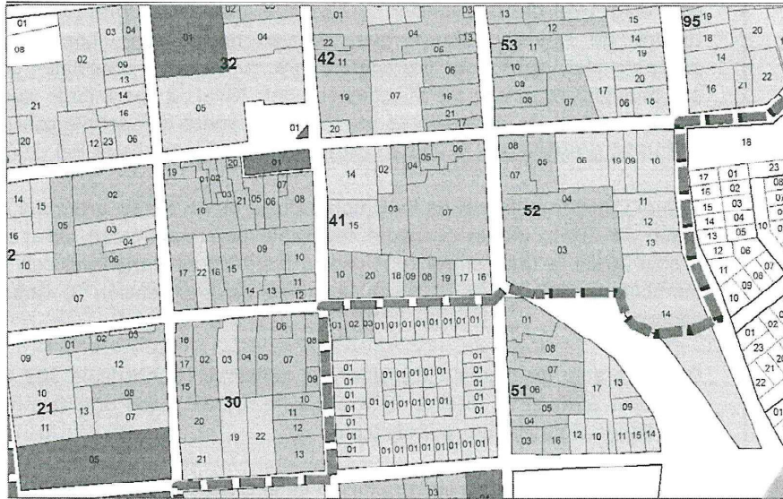
Imagen 2. Detalle del Plano F-02, Niveles Permitidos de Intervención, parte integral de la Resolución 1804 de 2017. La manzana 41 presenta los predios 10 y 20, señalados con nivel permitido de intervención 2.

Continuación de la Resolución: "Por la cual se modifica el Plan Especial de Manejo y Protección del Centro Histórico de Barichara, el Camino a Guane y sus Zonas de Influencia, aprobado mediante Resolución 0688 del 20 de marzo de 2015 y sus modificaciones"